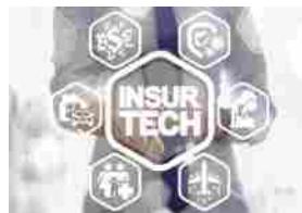
Investimenti globali in insurtech in aumento del 38% nel 2021 per più di 9,3 miliardi di euro