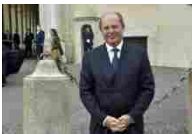
Generali, assemblea verso il 70%