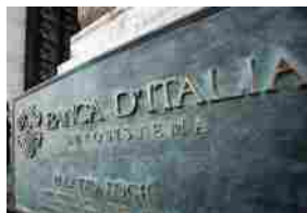
Bankitalia: rischi significativi su 20 mld di certificates